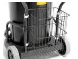
PORTACCESORIOS INDUSTRIAL OPCIONAL