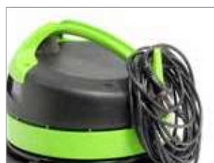
GANCHO PARA CABLE