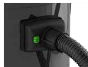
LA MANGUERA SE FIJA DE FORMA FIABLE Y SEGURA