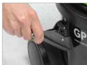
GANCHOS MUY FLEXIBLES